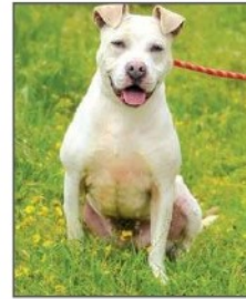
• MYANCA Staff femelle. Chien de catégorie 1. Née en 2016. Elle s'entend bien avec ses congénères mâles. Chienne très affectueuse.