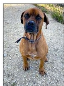
• OTHELLO Mâle croisé boxer. Né en 2018. Il s'entend bien avec ses congénères femelles. Il est adorable avec les humains.