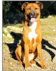
• NALA Beauceron femelle. Née en 2017. Elle s'entend bien avec ses congénères. Chienne très gentille.