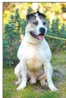
• IROS Staff mâle, inscrit au Lof. Chien de catégorie 2, né en 2013. Il ne s'entend pas avec ses congénères. Il a besoin d'une éducation pour apprendre à gérer sa force et ses émotions. Il est très affectueux avec les personnes qu'il connaît mais il devra poursuivre le suivi avec un vétérinaire comportementaliste.