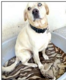
• SPIKE Mâle, croisé husky. Né en 2019. Il a besoin d'être dans une maison avec un jardin. Il s'entend bien avec ses congénères femelles. Il est très joueur et très affectueux.