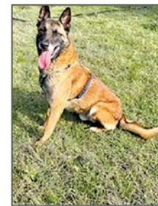
• BOYCA Malinois mâle. Né en 2017. Chien parfaitement éduqué. C'est un super chien pour les connaisseurs de la race de préférence. Il est très proche de l'homme mais ne s'entend pas avec ses congénères.