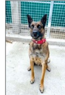
• PHOENIX Mâle croisé malinois. Né en 2019. Il est parfaitement éduqué mais a besoin de travailler car encore très réactif en laisse. Il est adorable lorsqu'il connaît les personnes. Il devra poursuivre son suivi avec un vétérinaire comportementaliste.